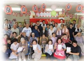
燃えろ!サマーカーニバル!!