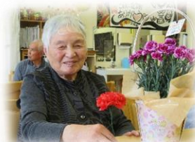
母の日♡ありがとう