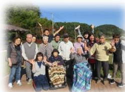
外出行事の一コマ