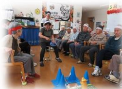
白熱の輪投げ大会